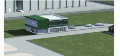
* Genomik Seleksiyon ve Embriyo Transfer Mer.