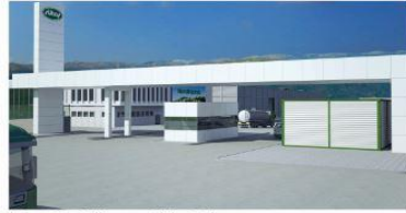
* Süt Fabrikası_Giriş Takı