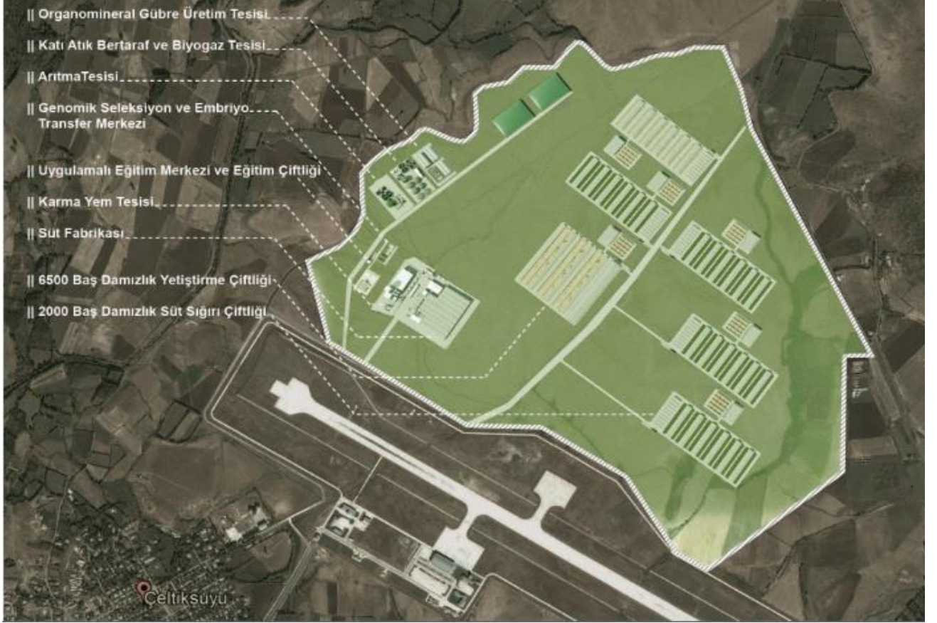
Görsel 1. Bingöl Entegre Süt Tesisi Yerleşke Planı