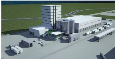
* Karma Yem Tesisi