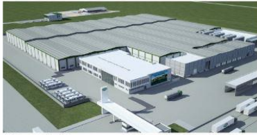
* Süt Fabrikası