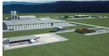
* Uygulamalı Eğitim Merkezi ve Eğitim Çiftliği